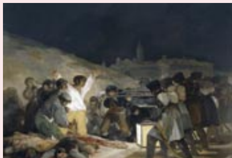
El tres de mayo de 1808 en Madrid de Francisco de Goya