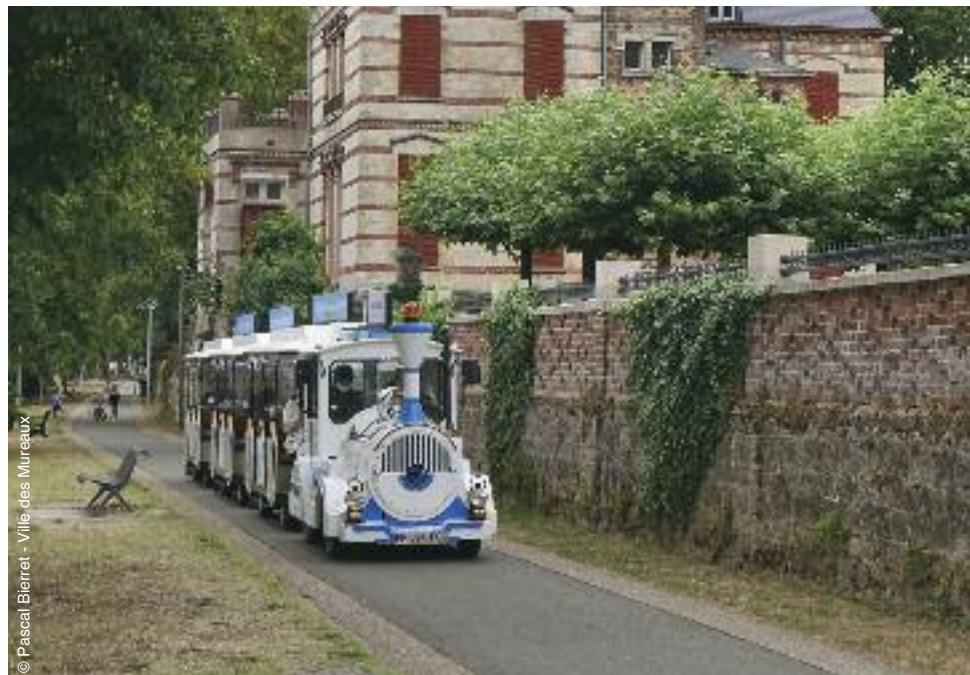
© Pascal Bérrer - Ville des Mureaux