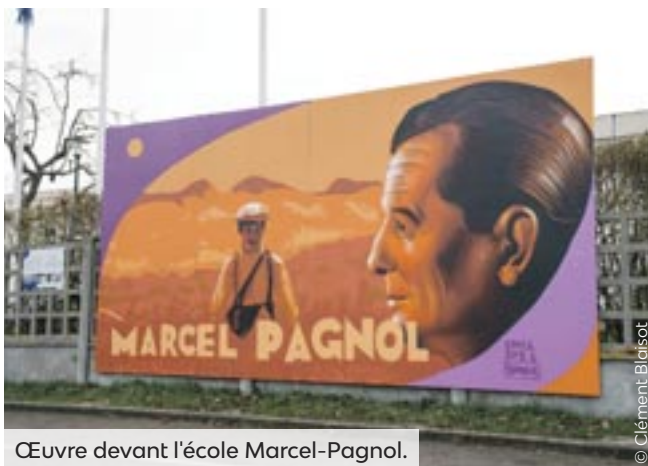
Œuvre devant l'école Marcel-Pagnol.