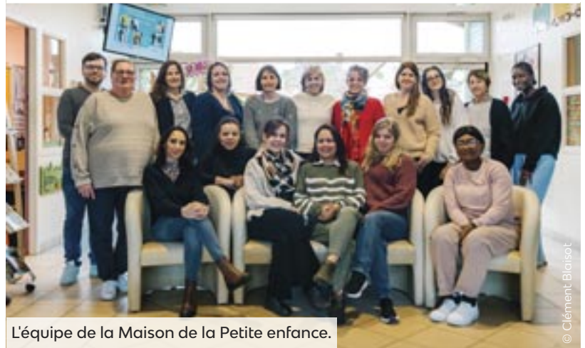
L'équipe de la Maison de la Petite enfance.