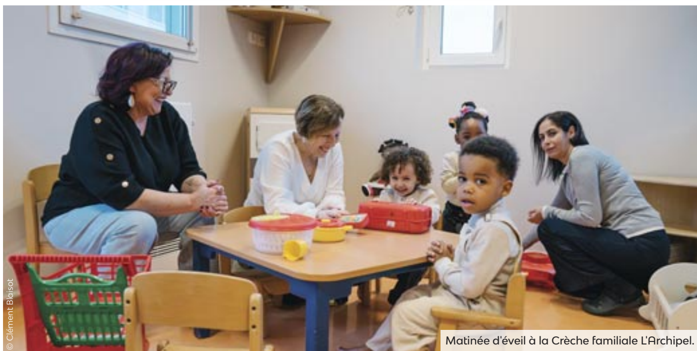
Matinée d'éveil à la Crèche familiale L'Archipel.