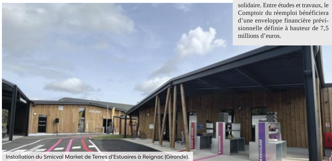
Installation du Smicval Market de Terres d'Estuaires à Reignac (Gironde).

Le projet du Comptoir s'inscrit dans le cadre de la loi anti-gaspillage pour une économie circulaire (AGEC) du 10 février 2020 qui impose des zones de dépôt pour les objets réemployables, mis ensuite au service des acteurs de l'économie sociale et solidaire. Entre études et travaux, le Comptoir du réemploi bénéficiera d'une enveloppe financière prévisionnelle définie à hauteur de 7,5 millions d'euros.