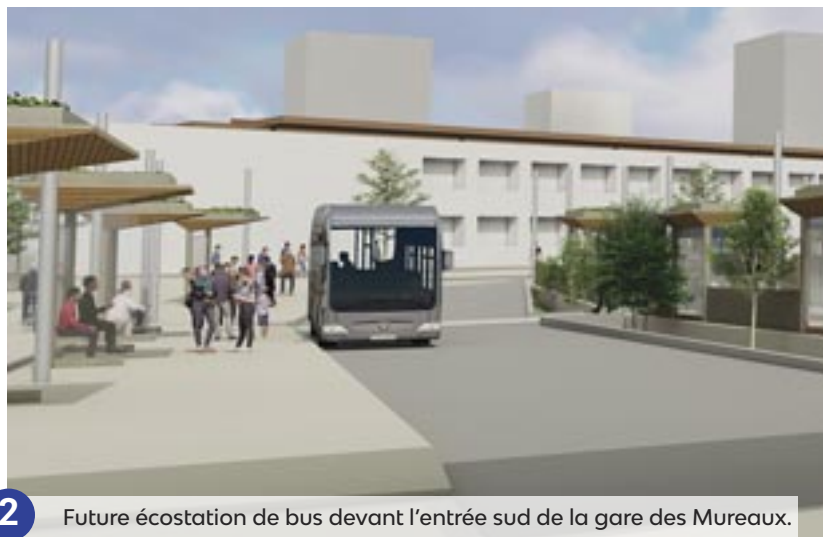
2 Future écostation de bus devant l'entrée sud de la gare des Mureaux.