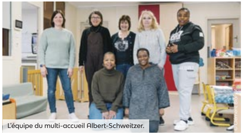
L'équipe du multi-accueil Albert-Schweitzer.