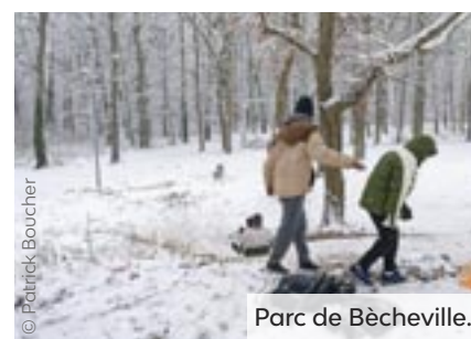
Parc de Bècheville.