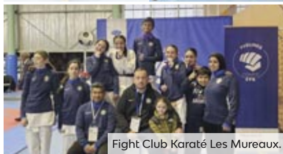
Fight Club Karaté Les Mureaux.

La Ville de Coignières a accueilli, en janvier 2026, les Championnats des Yvelines de karaté. À cette occasion, nos clubs muriautins ont raflé un grand nombre de médailles. Avec 15 combattants engagés et 15 médailles remportées : le Budo Club des Mureaux réalise un carton plein. De son côté, les karatékas du club Fight Club Karaté Les Mureaux ont brillé avec 5 médailles ! Ces performances confirment la dynamique du club, après la dernière Coupe des Yvelines Enfants où le club a remporté 13 médailles. Bravo à ces clubs et sportifs qui vont porter les couleurs de la ville aux Championnats d'Île-de-France, prévus en mars prochain.