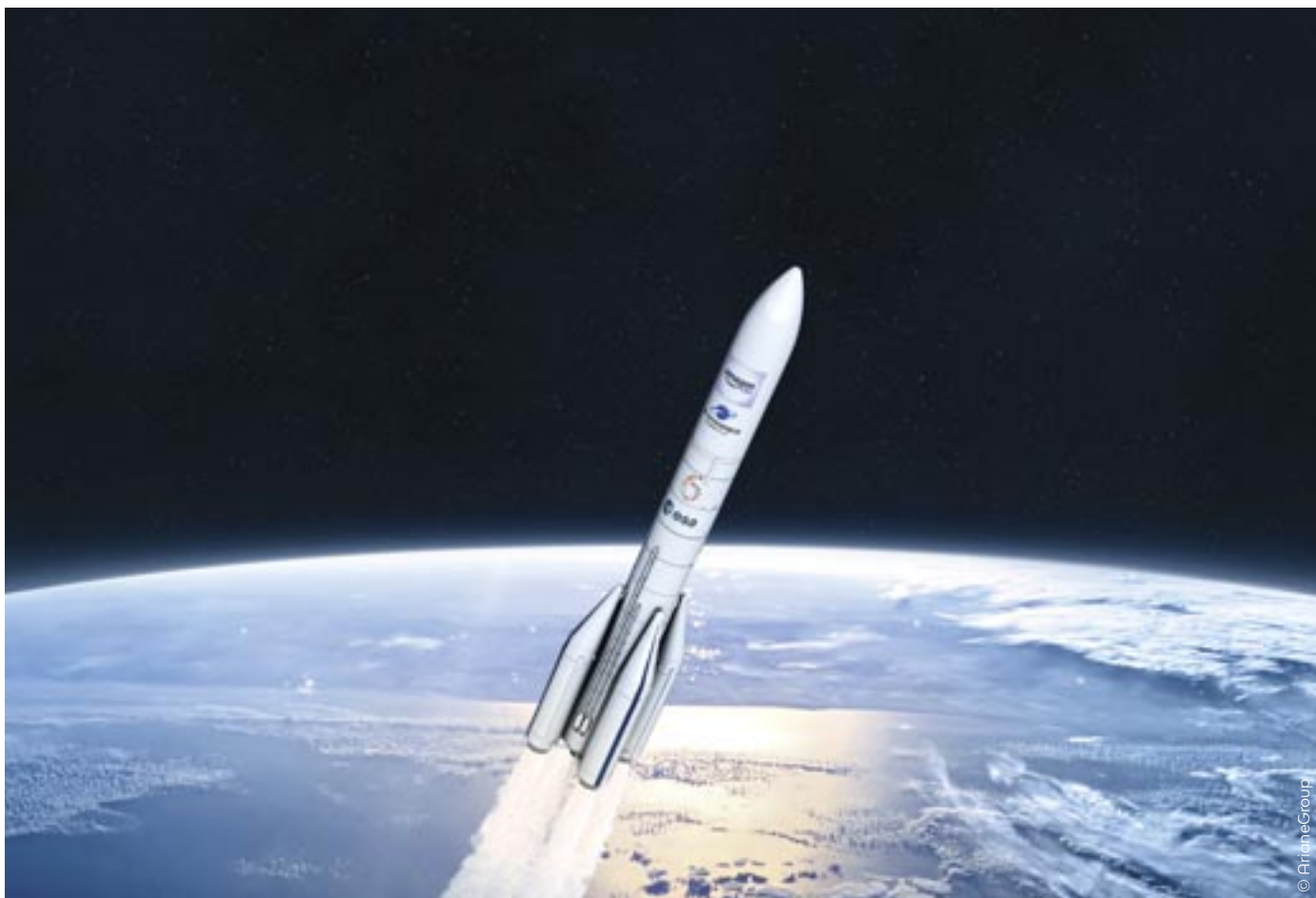
Le lanceur Ariane 6 dans sa configuration la plus puissante, appelé Ariane 64, dont l'étage central est construit sur le site des Mureaux.