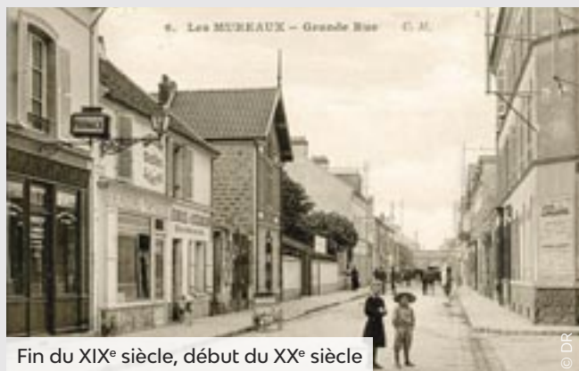
Fin du XIX e siècle, début du XX e siècle