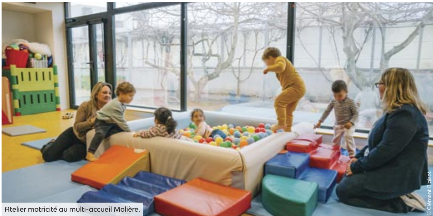
Atelier motricité au multi-accueil Molière.