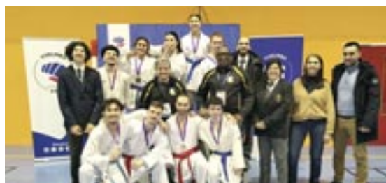
Budo Club des Mureaux.