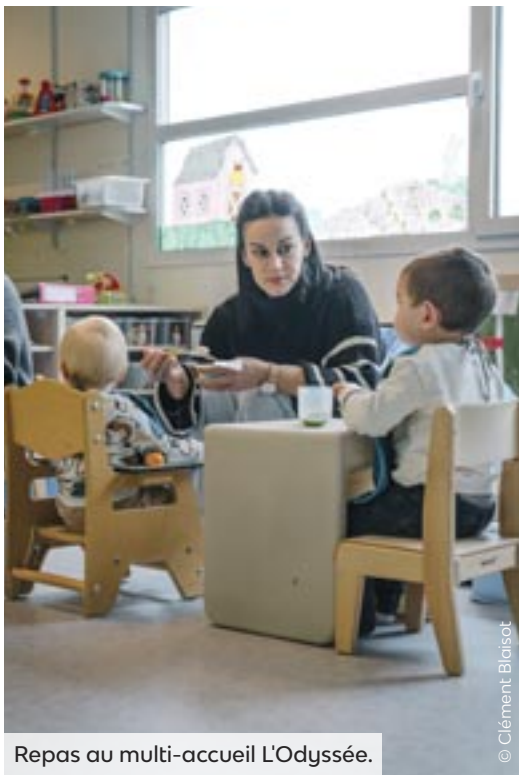
Repas au multi-accueil L'Odyssée.