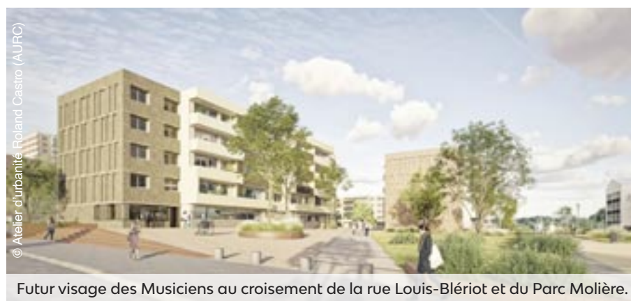
Futur visage des Musiciens au croisement de la rue Louis-Blériot et du Parc Molière.

Au fil des réalisations et des projets, Les Musiciens change progressivement de visage. Un quartier plus agréable, plus vivant et résolument tourné vers l'avenir, qui se construit jour après jour avec et pour ses habitants dans la continuité de l'Écoquartier Molière.