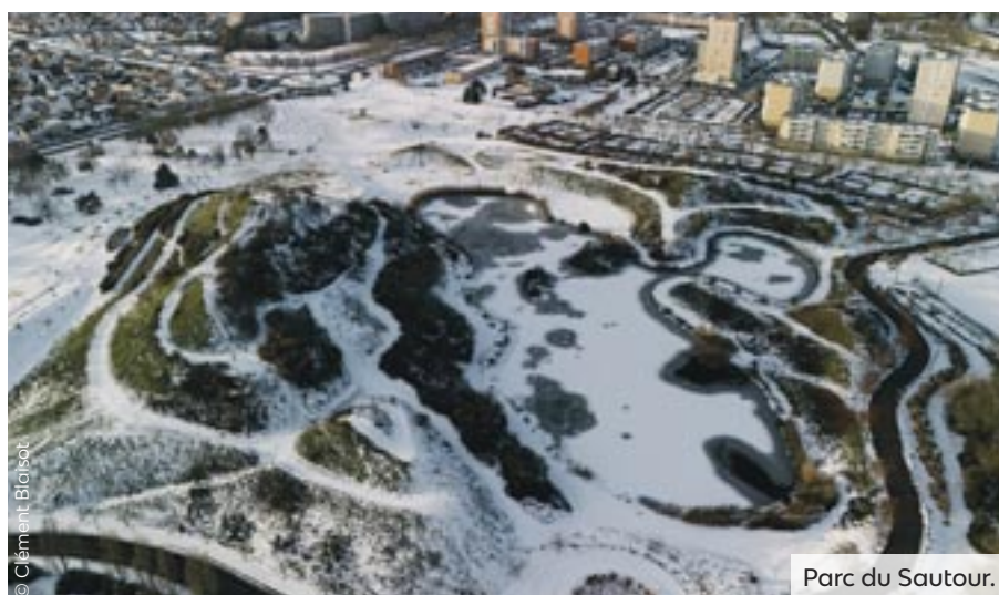
Parc du Sautour.