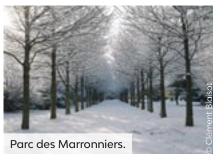
Parc des Marronniers.