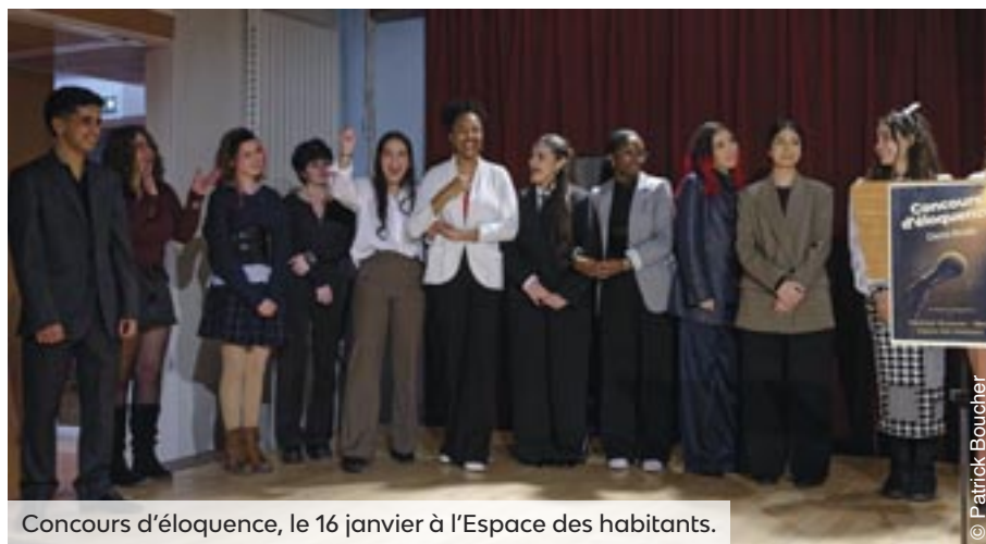
Concours d'éloquence, le 16 janvier à l'Espace des habitants.