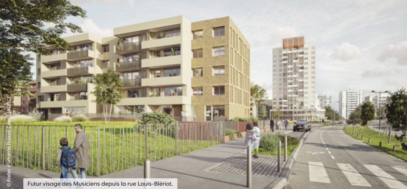
Futur visage des Musiciens depuis la rue Louis-Blériot.