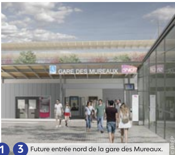
1 3 Future entrée nord de la gare des Mureaux.