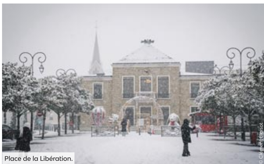
Place de la Libération.

Les Mureaux a connu un épisode neigeux intense au début du mois de janvier 2026. Tandis que les agents municipaux étaient sur le front pour saler et déneiger nos rues, la ville a revêtu un manteau blanc. Voici quelques images de ces jours de neige dans notre ville.