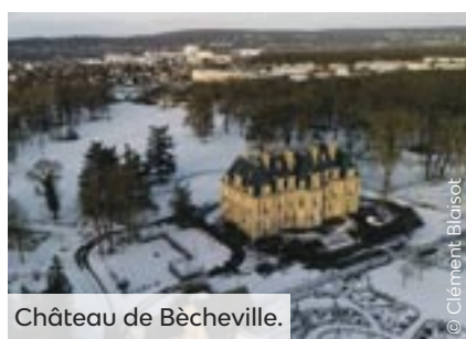
Château de Bècheville.