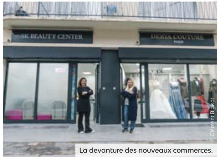
La devanture des nouveaux commerces.