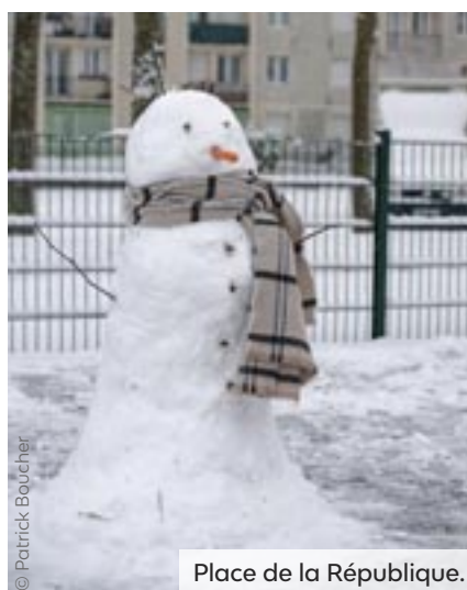
Place de la République.