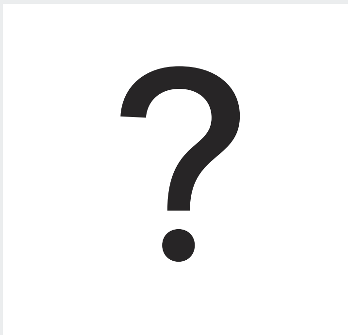
Maire des Mureaux 2026 - 2032